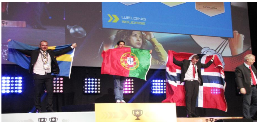
O único lugar onde o sucesso vem antes do trabalho é no dicionário. (Autoria atribuída a Albert Einstein)